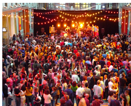
CENTQUATRE, Bal Pop