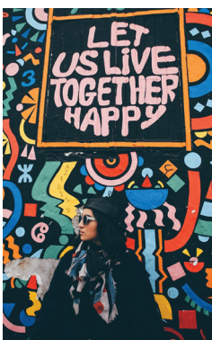
Camélia Jordana