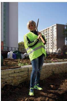
Thierry Boutonnier, Hind, « Prenez Racines », 31 octobre 2014